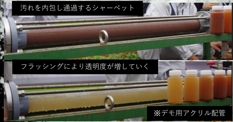
汚れを内包し通過するシャーベット