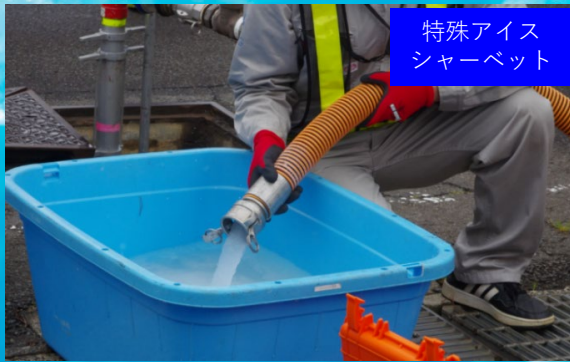
特殊アイスシャーベット

アイスピグ洗浄工法は老朽化した管路をよみがえらせる、管にも環境にもやさしい技術です。