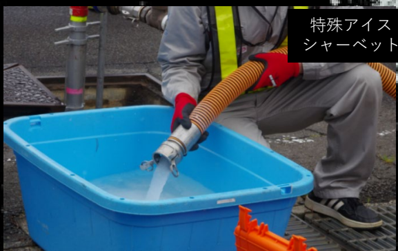
特殊アイスシャーベット

アイスピグ洗浄工法は老朽化した管路をよみがえらせる、管にも環境にもやさしい技術です。